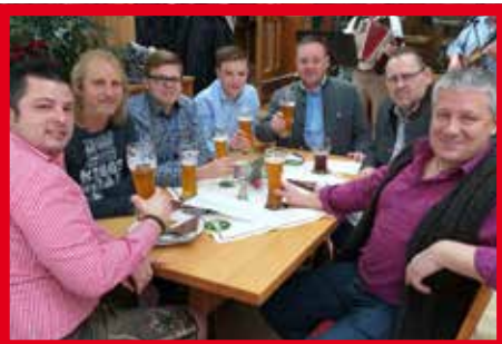
Fröhschoppen Passau Innstadt