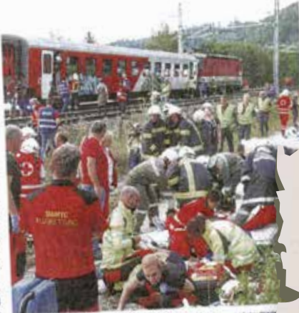
In nächsten Tagen folgt gemeinsame Nachbesprechung.

Feuerwehr: Zuerst wurden die Feuerwehren Wernstein und Schardenberg alarmiert. Bezirksleiter Gerhard Mayer bot sich ein unüberschaubares Bild - schreiende Verletzte. Sofort wurden die Feuerwehren Brunenthal, Wal-