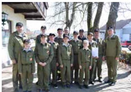
Hier einige Übungsthemen aus dem jährlichen Übungsplan aufgezählt:

Natürlich durfte auch der Spaß nicht zu kurz kommen, gemischt mit praxisnahen Übungen, um die Jugendlichen, und seit vergangem Jahr bereits auch schon Jugendliche im Alter von 8 Jahren, für das spätere Einsatzwesen vorzubereiten.