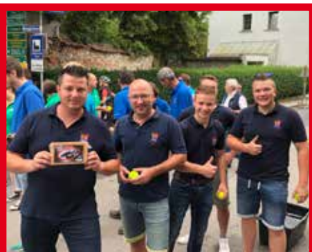
d'Musi am Inn der Stadtkapelle